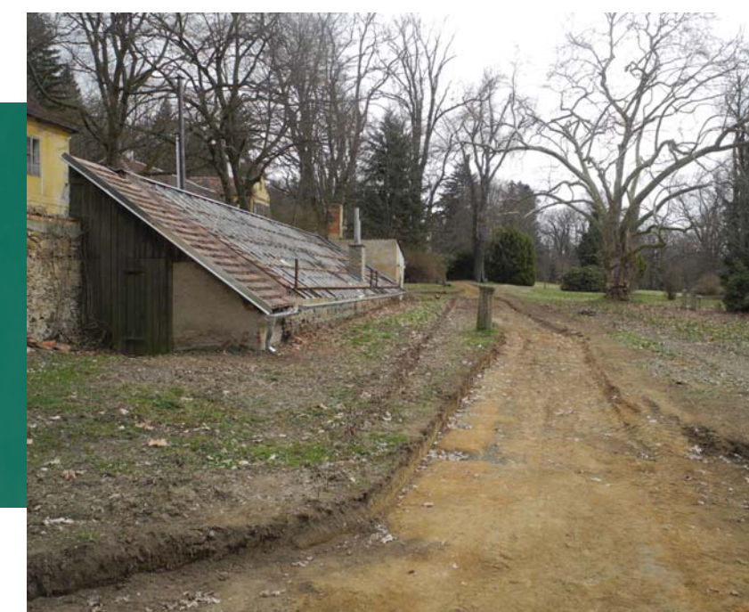
Oprava mlatových pěšin.